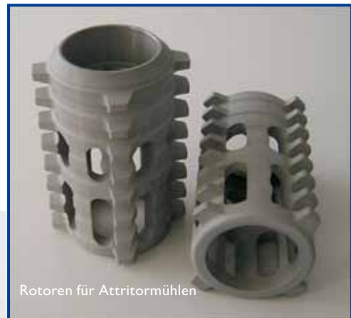
Rotoren für Attritionmühlen