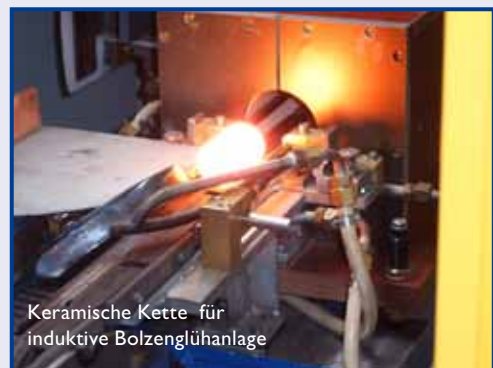
Keramische Kette für induktive Bolzenglühanlage